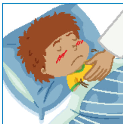
Pospanost, teško buđenje