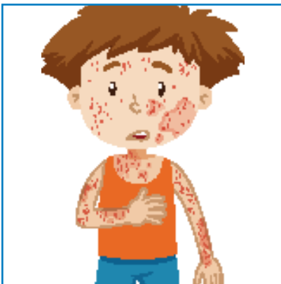
Blijeda, mrljama prekrivena koža, osip